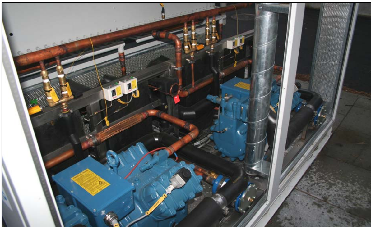
Detaljer fra maskinhus, bemærk sikkerhedsventil arrangement