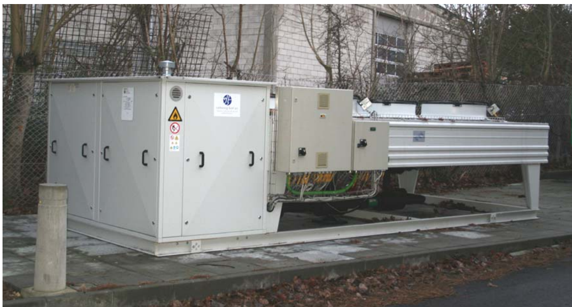
Vandkøleanlægget med maskinhus og luftkølet kondensator

Aggregatet er opstillet i terræn tæt på skel. Kølerør med glykol (30 % PG 7/12 °C) er ført til et teknikrum under en kørevej, der passerer langs bygningen. I teknikrummet er ventilationsanlæg med køleflade placeret og herfra afgrenes stikledning til serverrummet, hvor en fancoil er placeret under loft.