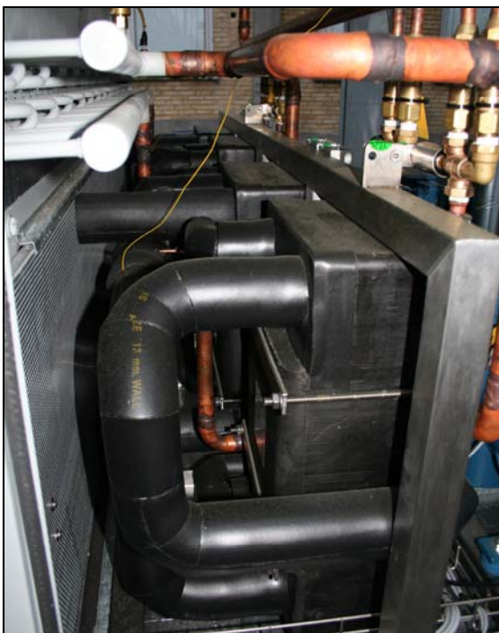
Pladevekslere: Vandkølere og interne varmevekslere